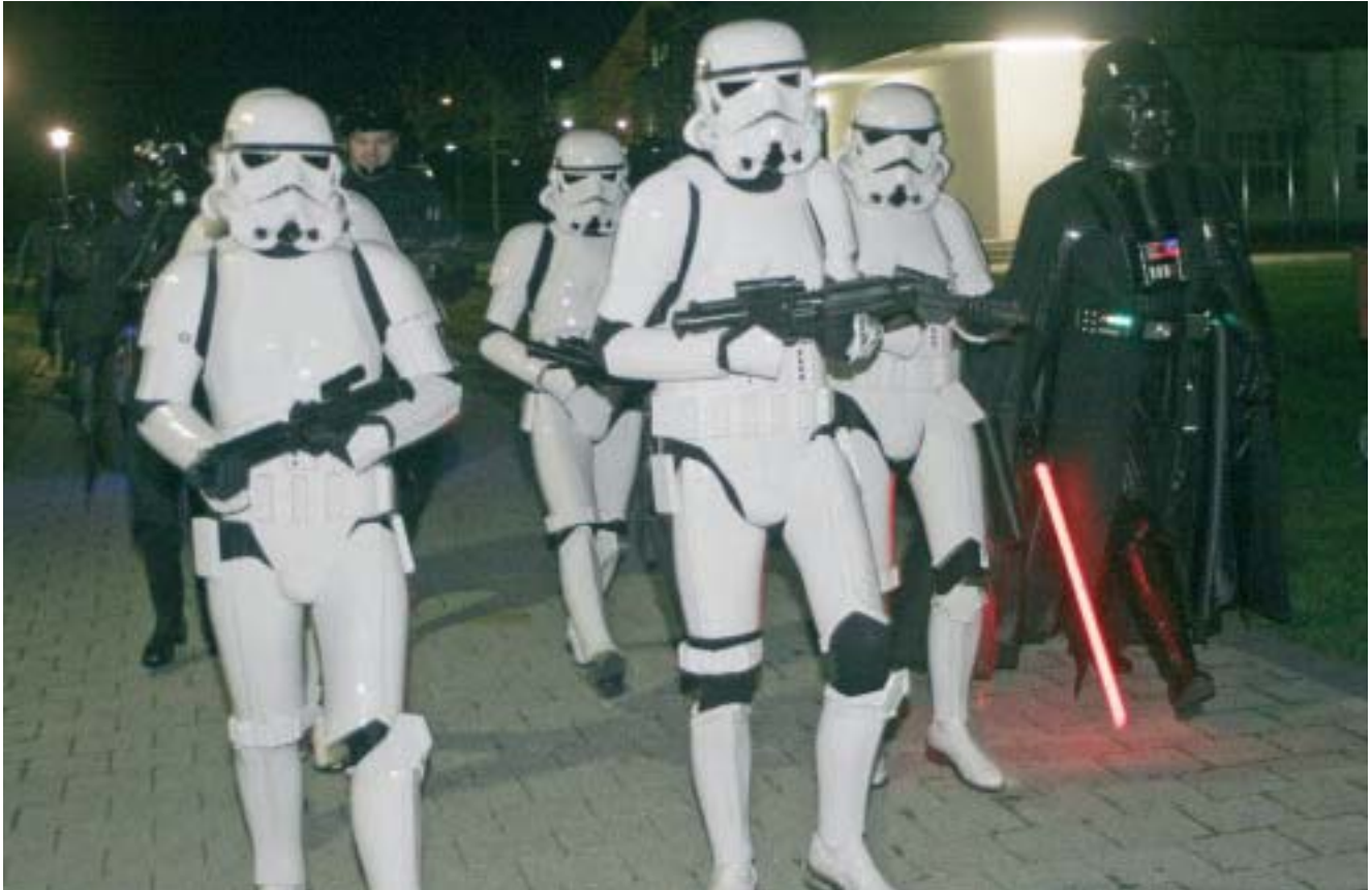
Bild 8: Darth Vader und seine Sturmtruppen auf dem Weg zur BWL-Vorlesung