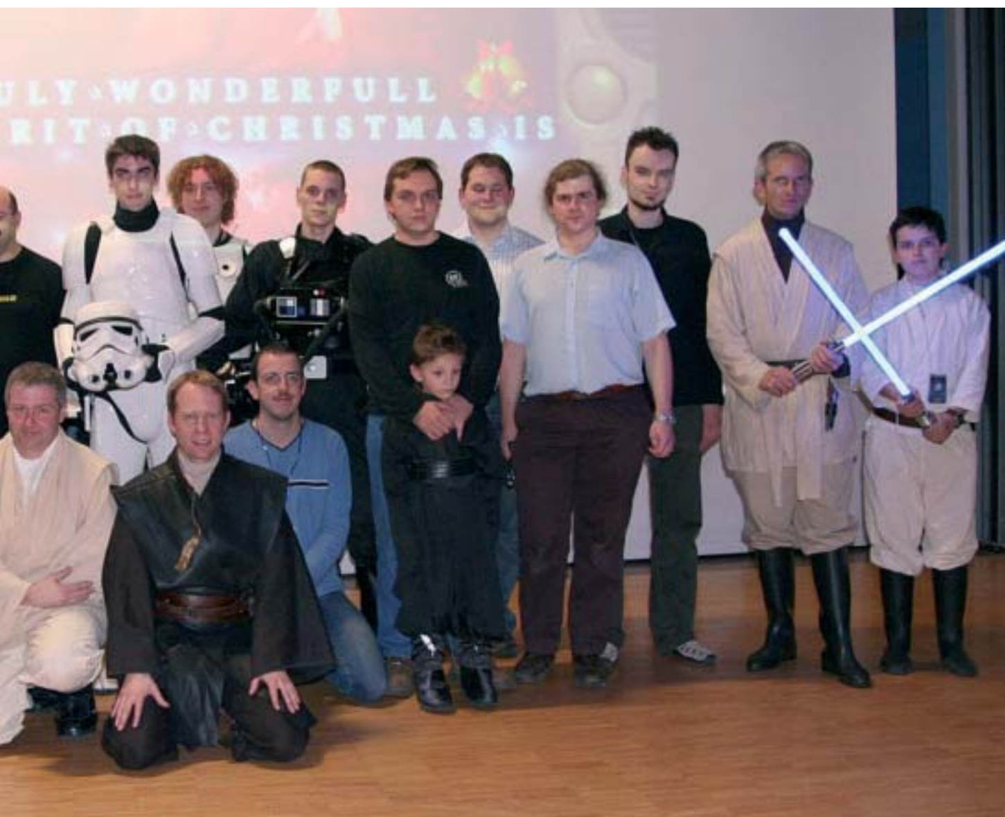
Bild 13: Die Crew mit einigen Helfern und Kostümträgern nach der Veranstaltung

Für weitere Informationen wie Presseberichte, Bilder, Auszüge aus Vorlesungen, Videosequenzen, Radiointerviews und vor allem zukünftige Termine verweise ich auf: www.startrekvorlesung.de (Hubert Zitt)