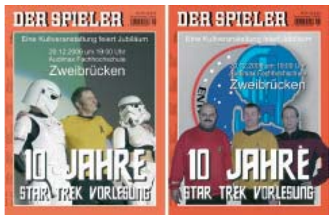
Bild 2: Hinweise auf die Jubiläumsveranstaltung

Neben dem großen „Hauptplakat“ wiesen kleinere Plakate darauf hin, dass es sich diesmal um eine Jubiläumsveranstaltung handelte. Von diesen kleineren Plakaten, die überall in den Schaukästen zu sehen waren, gab es insgesamt 14 verschiedene Motive. Zwei davon zeigt das folgende Bild.